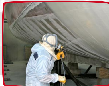
onderwater verfsysteem spuiten