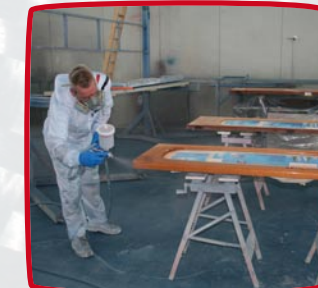
blank lakwerk spuiten