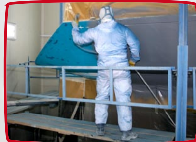
epoxy grondlaag spuiten