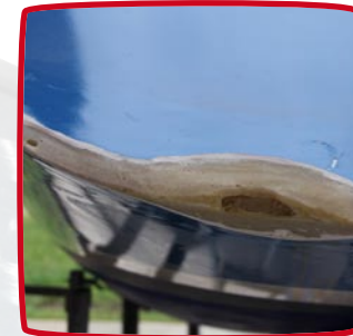
schade aan spiegel