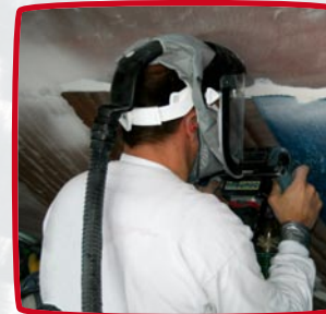
schillen onderwater verfsystemen