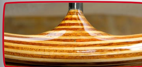
Stuurrad "Pinta Smeralda"