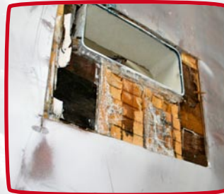
sandwichconstructie aangetast door vocht